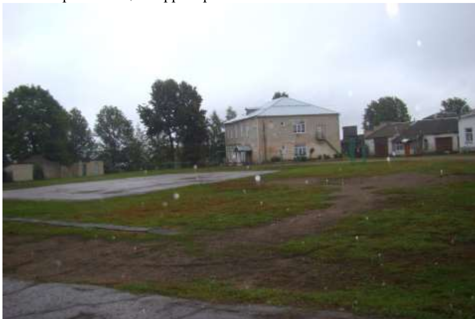
Фото 5 Вход на территорию