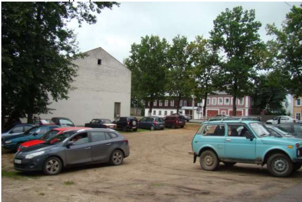
Фото 10 пути движения по территории, парковка